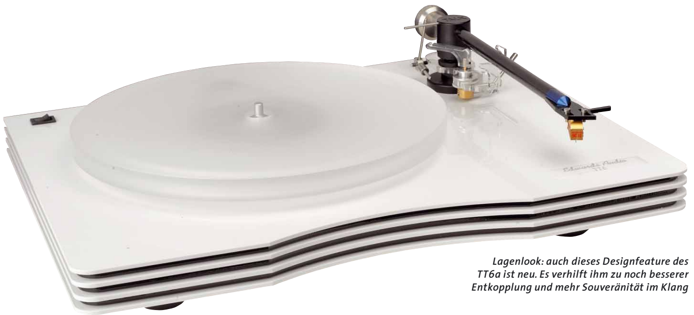
Lagenlook: auch dieses Designfeature des TT6a ist neu. Es verhilft ihm zu noch besserer Entkopplung und mehr Souveränität im Klang

müsste zwingend ein edles System in den A6. Sinn der Übung ist zu zeigen, wozu der Arm in der Lage ist. Ich habe ihn schon mit einem günstigen Audio Technica gehört, was ebenfalls hervorragend funktioniert.